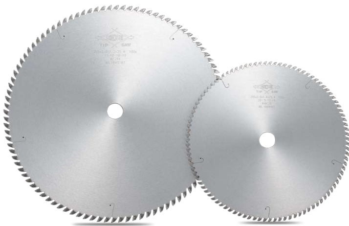
■BC交互リード刃型 BC-ATB (Alternative Top Bevel)